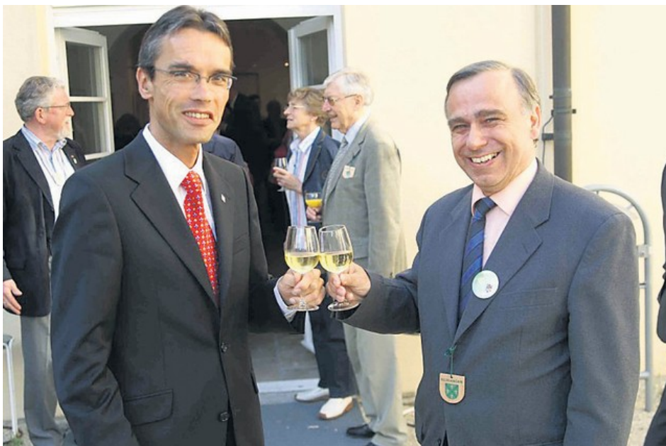
Präsident Dr.Rauchfuß und Oberbürgermeister Karl Hilsenbek Ellwangen

Peter Hauk gab auch grünes Licht für den Zuschuss in Höhe von 30.000 Euro seitens des Naturschutzfonds Baden-Württemberg der Landesregierung an den Schwäbischen Albverein e.V: für die Anschaffung eines neues Fahrzeugs für die hauptamtliche Naturschutzarbeit.