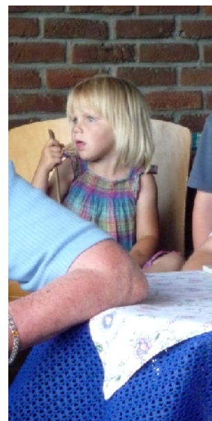
und eine junge ZuhörerIn