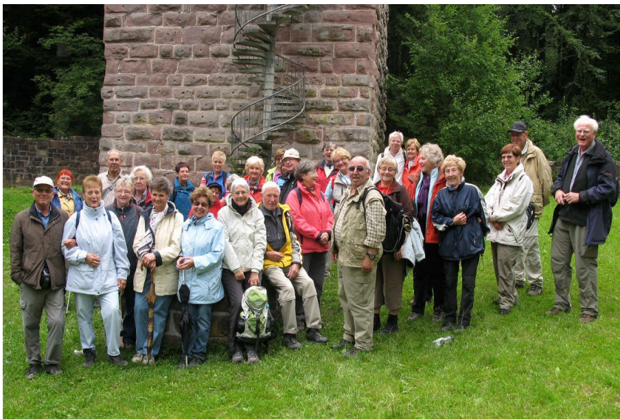
Vor dem Aussichtsturm der Ruine Mantelberg