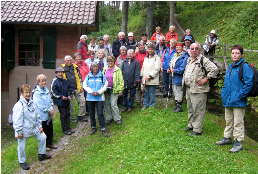
Die Albvereinler beim Bösingger Wasserhäusle